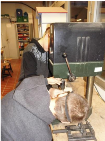
Maschinen verstehen & bedienen