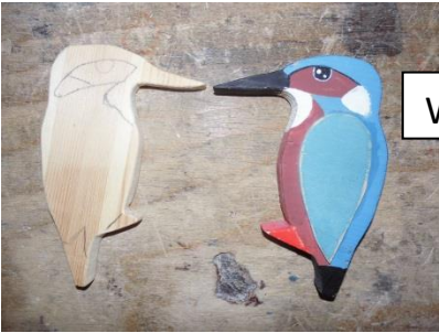
Werkstücke aus Holz und Metall herstellen