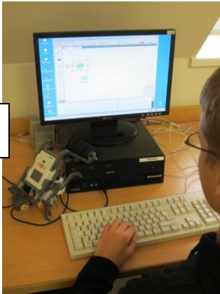
mit dem PC arbeiten